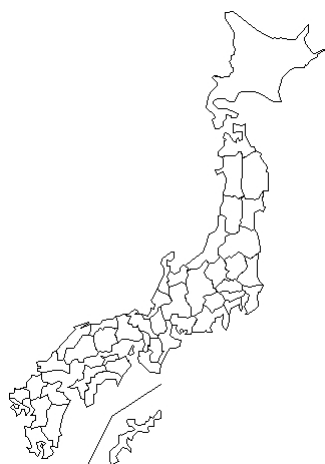
報告なし Human herpes virus 6