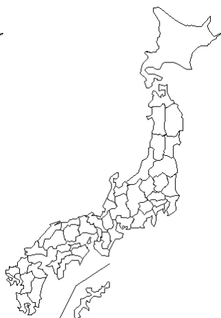
報告なし Coxsackievirus A12